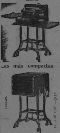
Las más compactas