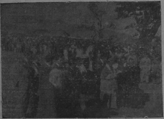
Momento de bendecir el aeroplano el señor Obispo

donación de los donantes de este aeroplano y por especial recomendación de ellos, yo lo designo con el nombre de "COSTA RICA". Que