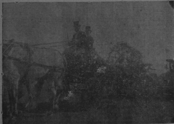
Llegada de la carroza con la madrina del aeroplano y la señorita Castillo

En representación de los donantes de este aeroplano y por especial recomendación de ellos, yo lo designo con el nombre de COSTA RICA Que tenga larga vida, que hienda los aires y remonte la altura con toda felicidad y que sea su nombre augurio de nuevos triunfos para el intrépido aviador.